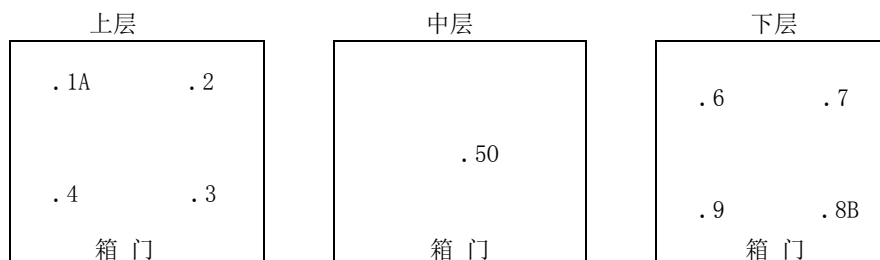
图 1 砂尘试验设备容积小于或等于 2m 3 时温度、湿度测量点布放位置示意图